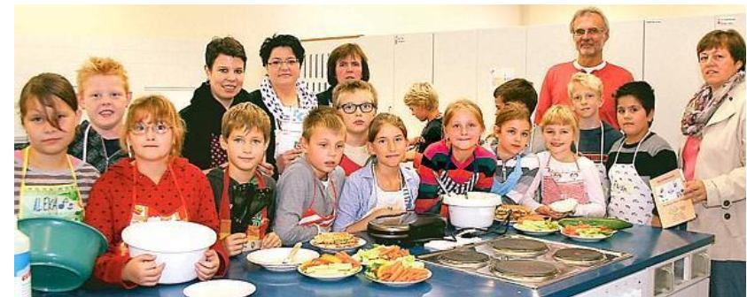
Verein "Kochen mit Kindern" e.V.