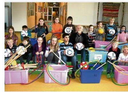
Spielekisten für jede Klasse