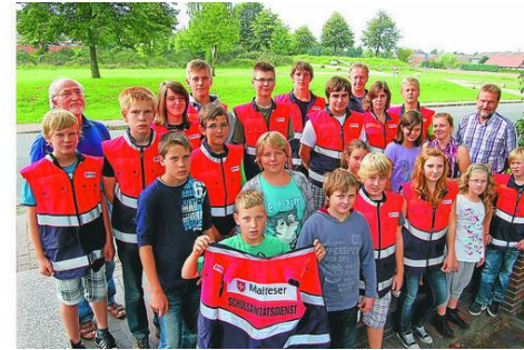
Westen für Schulsanitäter